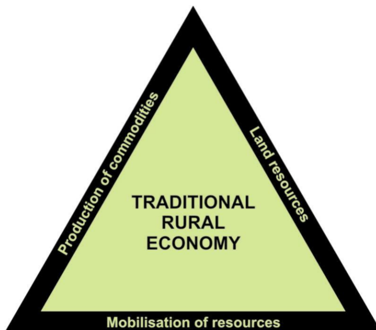
Ffigur 7.1 Tair ochr y fenter wledig

traditional rural economy – Yr Economi Wledig Draddodiadol